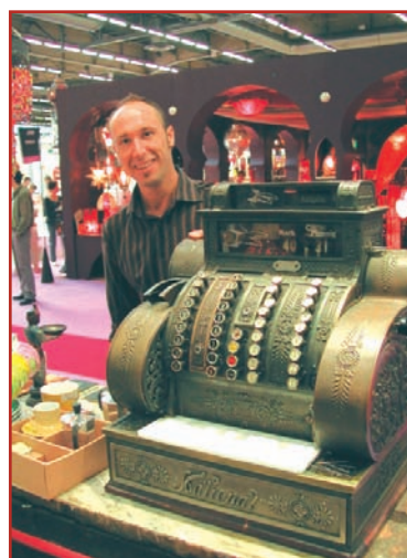
BLITZ à la pointe de l'innovation