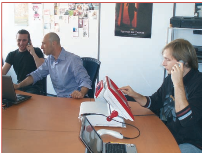
L'assistance BLITZ en action