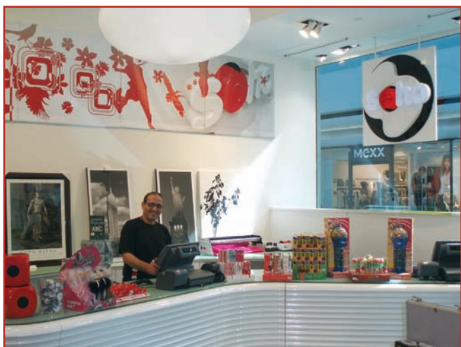
Un utilisateur souriant et détendu

« Sans que cela ne me prenne plus de temps qu'un encaissement classique, en utilisant SEM, j'ai aujourd'hui une vision plus précise de l'activité de mes deux magasins. Les statistiques, faciles à interpréter, me permettent de mieux positionner mes achats et d'éviter les erreurs d'approvisionnement. SEM m'aide à prendre de meilleures décisions. »